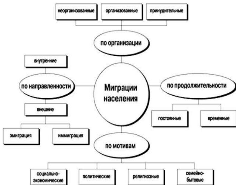
Рис. 1. Типы миграции

Миграция представляет собой территориальное перемещение людей, что имело место на протяжении всей истории человечества. Сегодня выделяют различные типы миграции: по направленности, продолжительности, мотивам, организации (рисунок 1). Однако в центре внимания данной статьи будет находиться миграция по социально-экономическим причинам.