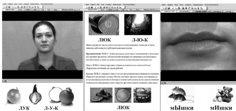
Рис. 1. Пример обучающих материалов для инофонов в программе АГ

Важная особенность АГ состоит в возможности совмещать прослушивание звукового материала с просмотром видеозаписей, на которых общим или крупным планом показан процесс его артикулирования. (рис. 1).