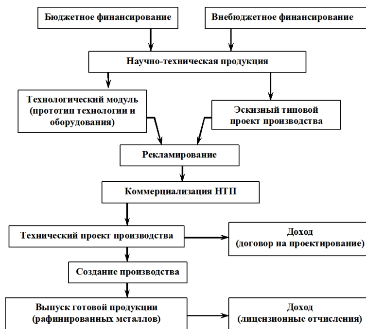
Рис. 2. Блок-схема коммерциализации научно-технической продукции

Нами разработана схема коммерциализации научно-технической продукции с целью внедрения на рынок технологических услуг в России и за рубежом. Блок-схема коммерциализации приведена на рис. 2.