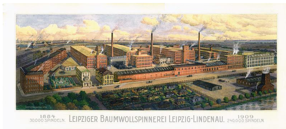
Рис.2 Общий вид фабрики Шпинерай.