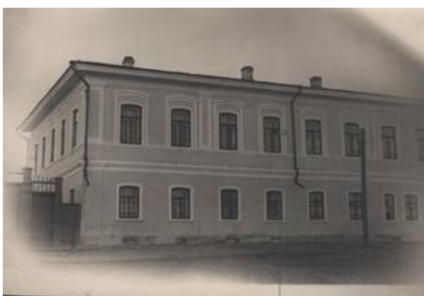
Рис. 1. Дом по ул. Петровского,1 (фото нач. XX в. из фондов ЕКМ)

Прямоугольное в плане каменное двухэтажное здание по ул. Петровского,1 главным северным фасадом в восемь оконных осей выходит на улицу Петровского, западным фасадом в пять оконных осей обращено в сторону Воскресенской церкви. (рис. 1).