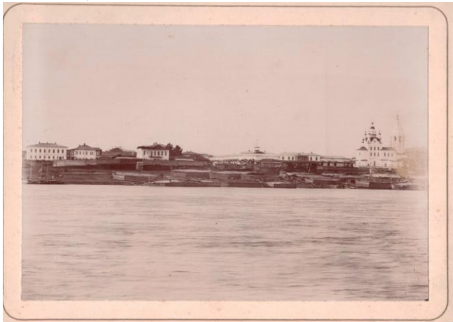
Рис. 3 Панорама Енисейска в нач. XX в.

После октябрьской революции 1917 г. дом Козицына разделил судьбу Воскресенской церкви и к 1928 г. был муниципализирован. При формировании списков муниципализированных домовладений проводилась их инвентаризация: составлялись подворные ведомости; акты технического состояния наружных сооружений домовладения; описание и акты технического состояния строений.