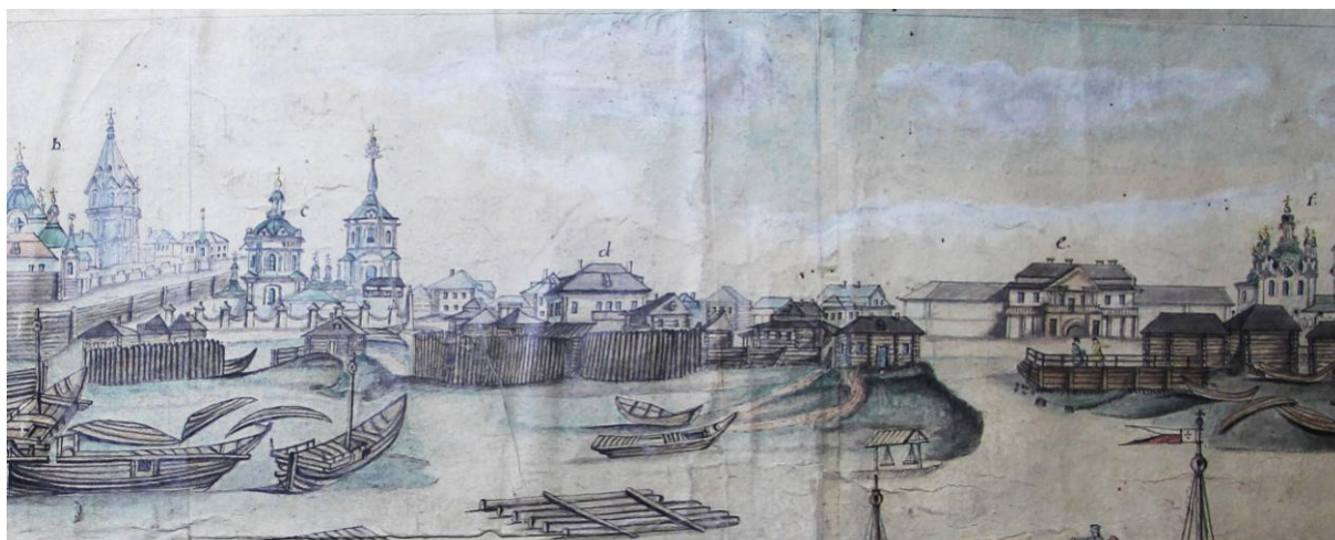
Рис.2. Фрагмент акварели А. Воронова «Вид окружного города Енисейска на левом берегу реки Енисея 1837 года» (из фондов ЕКМ)

Козицына». На основании этого рисунка авторами описан первоначальный облик памятника: «Судя по изображению на «Виде окружного города Енисейска» 1837 г., первоначально дом был одноэтажным, на высоком цоколе, в пять окон по обращенному к Енисею северному фасаду (три средних проема тесно сдвинуты, и перед ними устроено нечто вроде балкона или открытого крыльца) с высокой с изломом вальмовой крышей» [12, с. 2]. Этот документ лег в основу определения даты постройки и наименования памятника по его владельцу как «Дом Козицына, нач. XIX в.» (рис.2).