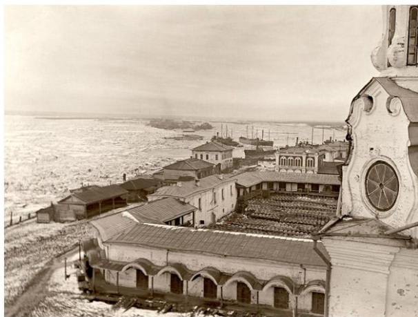
Рис. 4 Вид на гостинный двор и дом Козицына с крыши Преображенской церкви (из фондов ЕКМ)