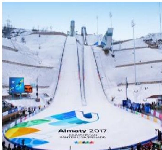
Прыжки на лыжах с трамплина