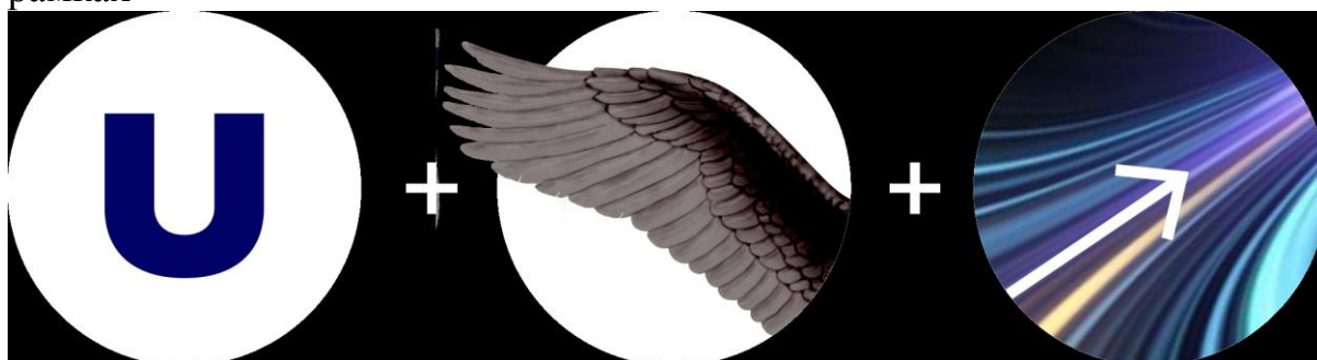
Логотип Всемирной зимней универсиады 2017 г.

В качестве талисмана представлен образ птицы Сокол, который воплощает в себе скорость, легкость, энергию и жажду побед- именно те качества, которые присущи молодым спортсменам. Слоган логически связан с логотипом и талисманом- птица, расправившая крылья, устремленная ввысь. «Расправление крыльев» демонстрирует путь становления спортсмена- с юных лет до перехода во взрослую жизнь и профессиональный спорт. Эти проекты будут согласованы с ФИСУ. В рамках