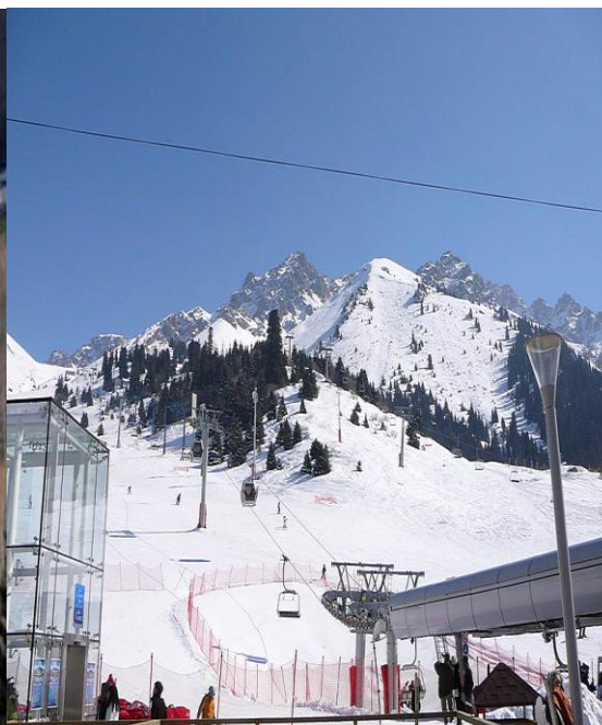
Горнолыжная база « Чимбулак»