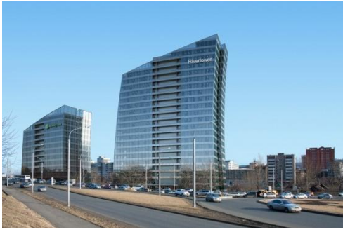
Рисунок 3. Административно-гостиничный комплекс по ул.Игарской