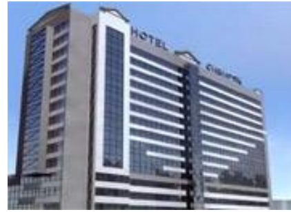
Рисунок 4. Трехзвездочная гостиница «Hilton»