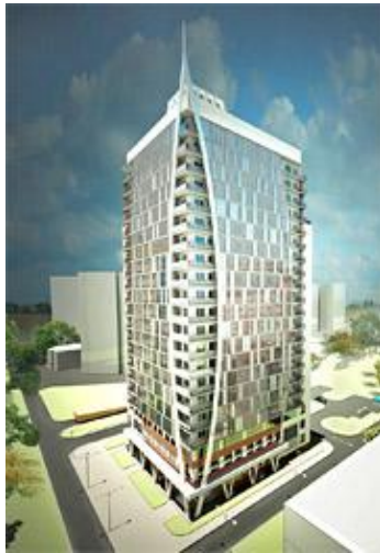
Рисунок 5. Трехзвездочная гостиница в микрорайоне Северный на пр. Комсомольском