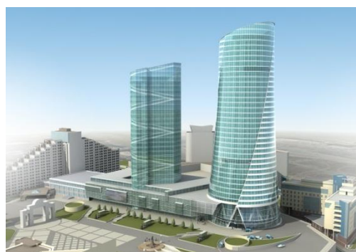
Рисунок 2. Бизнес-центр «Панорама»