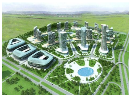
Рисунок 7. Предложенные проекты «Красноярск-Сити»