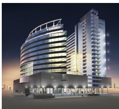
Рисунок 1. Бизнес-центр «Балансъ»

Учитывая сложившиеся экономические реалии зародились такие проекты как: бизнес-центр «Балансъ» (рис. 1), строительство которого уже ведется по ул. Маерчака; бизнес-центр «Панорама» (рис. 2), на Стрелке; административно-гостиничный комплекс по ул.Игарской (рис.3), трех звездочные гостиницы такие как «Hilton» (рис. 4) в районе схождения улиц Молокова и Взлётная; гостиница в микрорайоне Северный на пр. Комсомольском от застройщика ЗАО «Базилик» (рис. 5); 20-ти этажный пятизвездочный отель «Marriott» (рис. 6), срок завершения проекта – декабрь 2014г; также масштабный инвестиционный проект «Красноярск-Сити» идея которого обсуждалась уже давно, и для которого было разработано множество проектов (рис. 7).