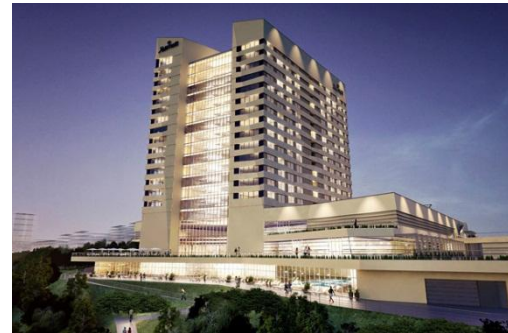
Рисунок 6. Пятизвездочный отель «Marriott»